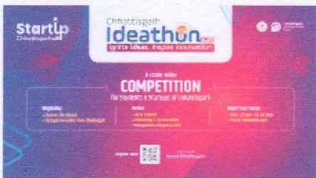
(16 x 9) Digital Backdrop.png 1397K