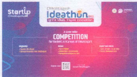
(16 x 9) Digital Backdrop.png 1397K