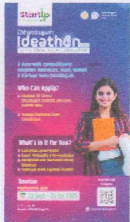
Startup Chhattishgarh Poster.png 2291K