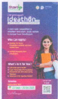
Startup Chhattishgarh Poster.png 64K